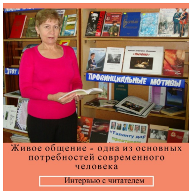
Живое общение - одна из основных потребностей современного человека

Живое общение - одна из основных потребностей современного человека/Интервью с читателем библиотеки.