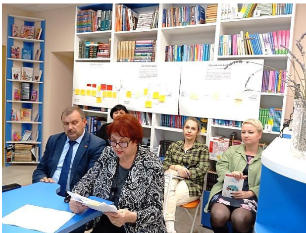
Участие в проекте «Эффективный регион» в Ставропольском крае