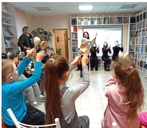
Встреча с фольклорной группой «Мастер»