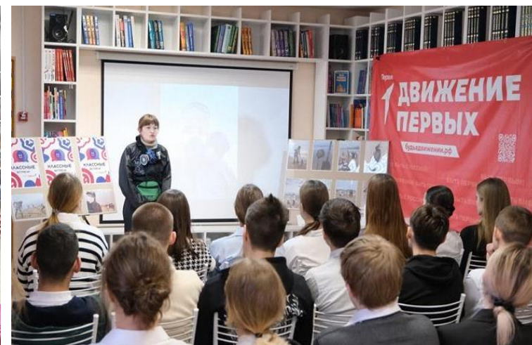
Встреча с эко-волонтером