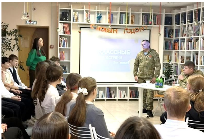
Классные встречи «День героев Отечества»