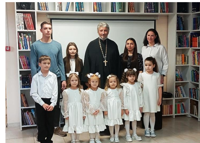
Праздничная программа «Маме — самые тёплые слова и песни»