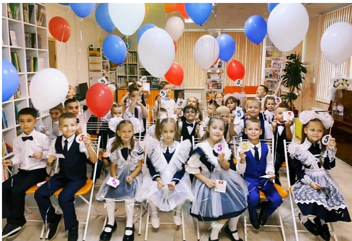
День знаний в библиотеке