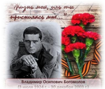
Владимир Осипович Богомолов (3 июля 1924 г. - 30 декабря 2003 г.)

Повторно попал на фронт 15 июня 1943 г. С 1943 года в войсковой разведке. Форсировал Днепр. Участник освобождения Тамани, Кировоградской наступательной операции. 12 января 1944 года вторично ранен, лежал в госпитале. После освобождения Минска до сентября 1944 года в подчинении Разведуправления Штаба 3-го Белорусского фронта и соединениях 2-го Белорусских фронтов, награжден Орденом Отечественной войны I степени за бои июня-июля 1944 г. по освобождению Белоруссии. В сентябре 1944 г. переходит из войсковой разведки в органы военной контрразведки, Главное управле-